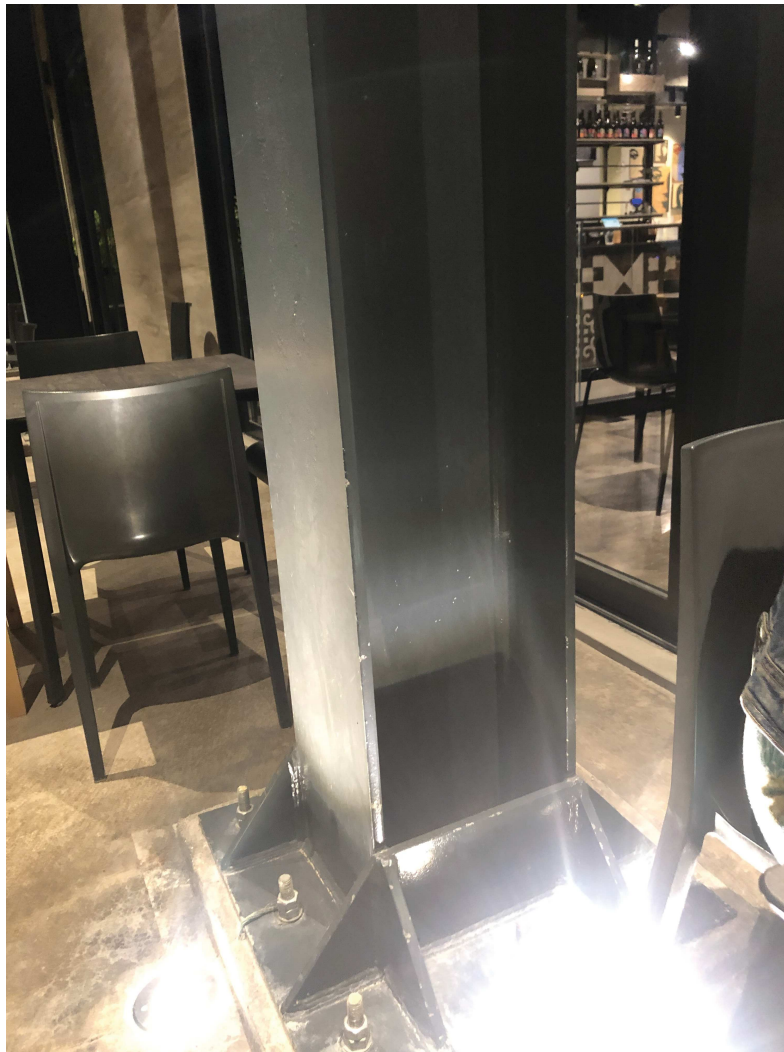
particolare di putrella in ferro

Il terrazzo del 1° piano munito di ombrelloni sarà utilizzato per la stagione: primaverile/estiva.; infine il parapetto è previsto in vetro antisfondamento con H minima = 1,00 ml.