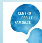
Centro per le famiglie ascolto informazione servizi