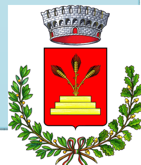
Comune di Gradara